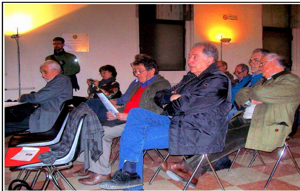
Presentazione della serata e dei relatori